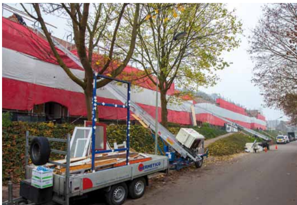
Zoals het er nu naar uitziet is de renovatie van de Mergelweg rondom maart/april 2015 afgerond.

Elke dag zijn er aan de Mergelweg op Sint Pieter 75 bouwvakkers bezig om de woningen van Servatius te renoveren. Een grote operatie die een nauwkeurige planning vergt en vaak wat aanpassingsvermogen van de bewoners vraagt. Maar het resultaat mag er straks zijn!