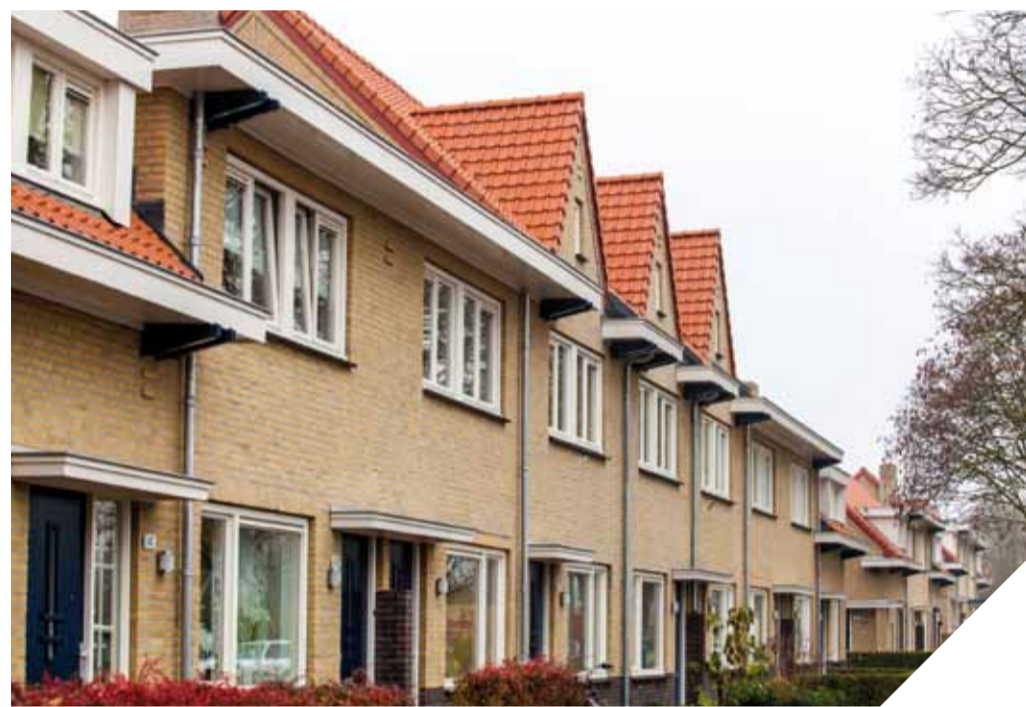
De eerste blokken woningen zijn aan de buitenkant al gerenoveerd.

In en rondom de woningen op de Mergelweg zijn een aantal beschermde diersoorten aangetroffen. Het gaat hier om vleermuizen, steenmarters, gierzwaluwen en huismussen. In het kader van Flora en Faunawetgeving is Servatius verplicht om deze dieren vooraf, tijdens en na de renovatie op te vangen. Dat betreft voorzieningen die tijdelijk of permanent van karakter zijn.